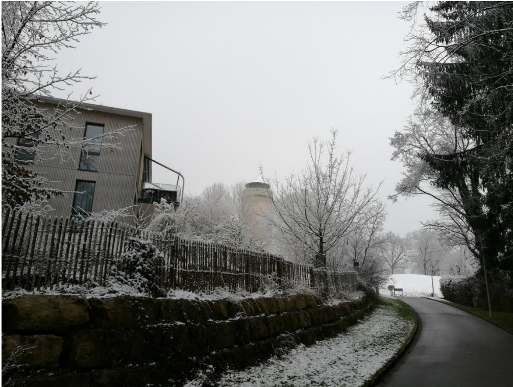
Aussicht auf den Wasserturm von der Wasserturm-Promenade

Über die Wasserturm-Promenade geht es zu einem weiteren Highlight, dem Wasserturm.