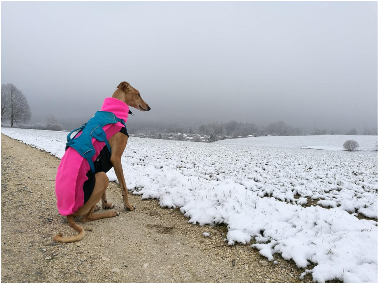
Nebelige Aussicht „Ob der Wanne“