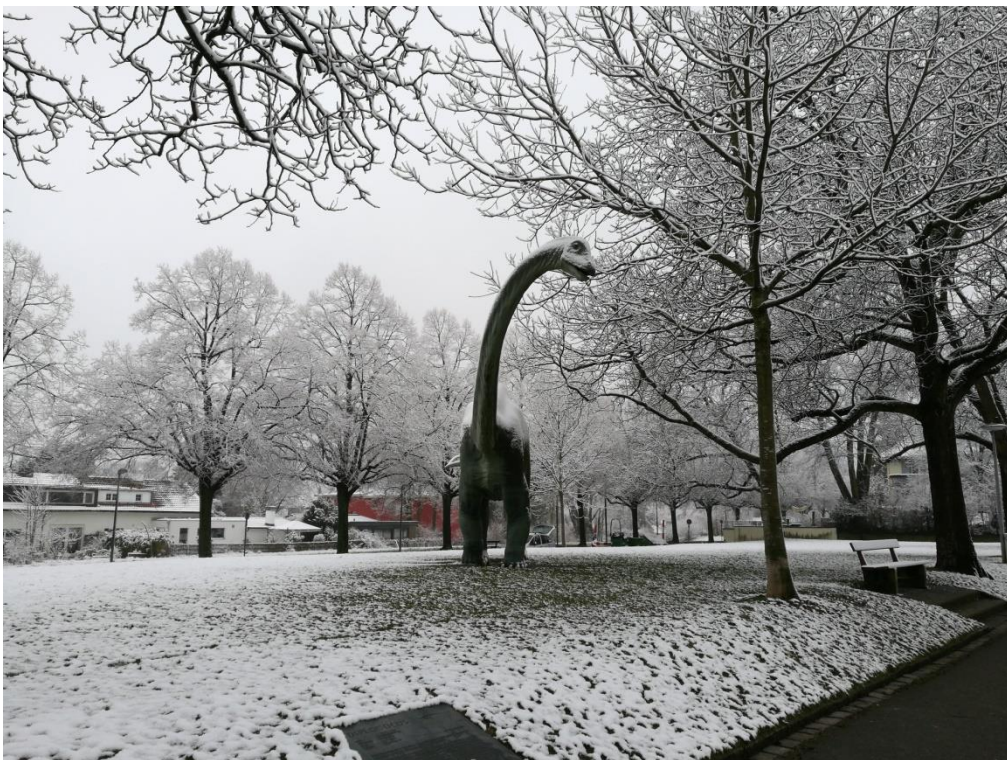
Dinosaurier auf der Batterieanlage vom Wasserturm

Über die Batterieanlage geht es nach links auf den Weg neben der Predigerhofstrasse.