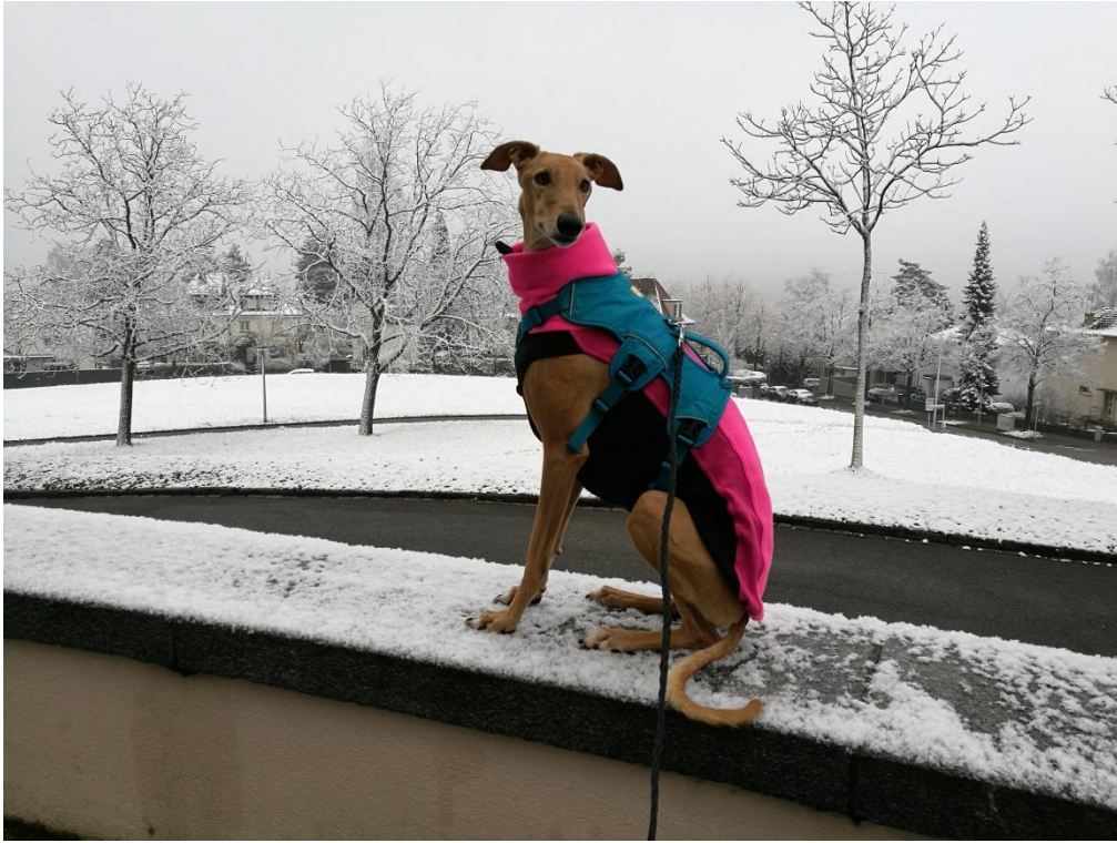
Finja beim Wasserturm

Über die Batterieanlage geht es nach links auf den Weg neben der Predigerhofstrasse.