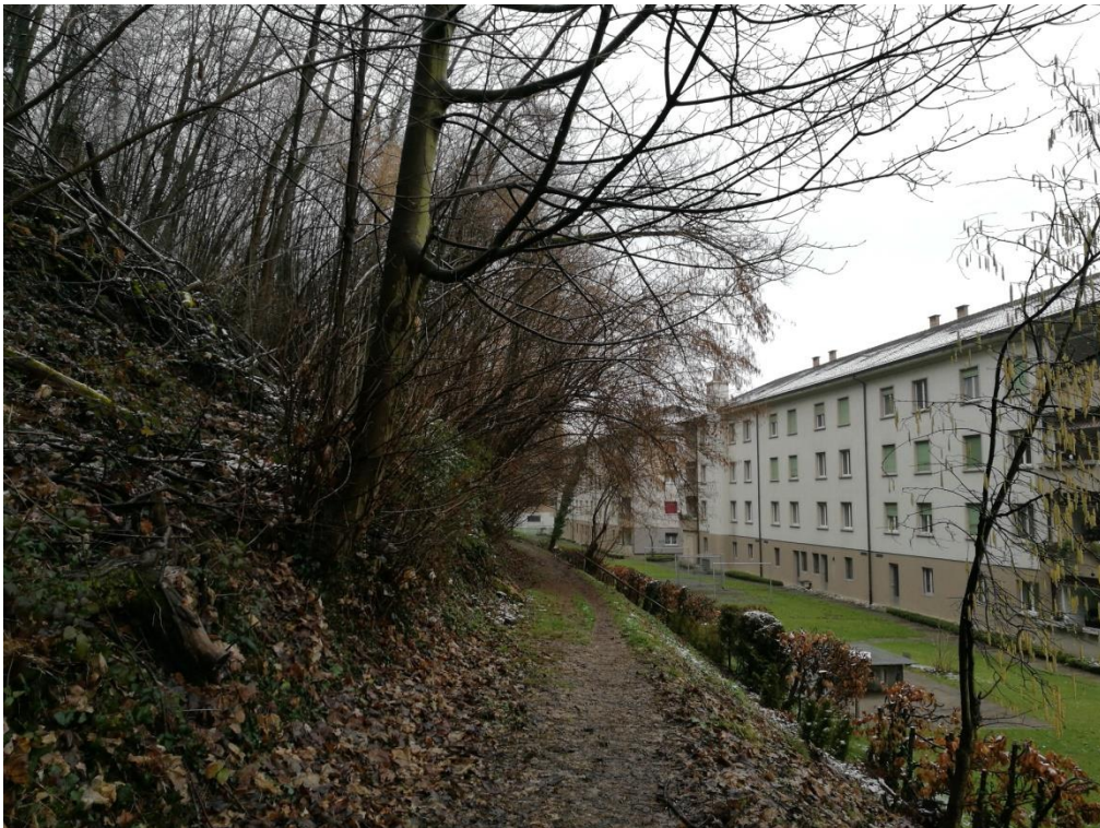
Trampelpfad parallel zur Reinacherstrasse

Nach dem Höllengewlein geht es rechts in das Zwölfjuchartenweglein und dann links auf dem selben Weglein weiter. Dem Weglein bis zur Giornicostrasse folgen, dann diese überqueren und etwas weiter unten links auf den Trampelpfad. Ich empfehle den Hund auf dem Trampelpfad angeleint zu lassen, da der Weg neben einer Siedlung verläuft und man auch an den dazugehörigen Spielplätzen vorbeigeht.