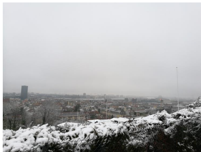
Aussicht auf Basel von Bruderholzrain